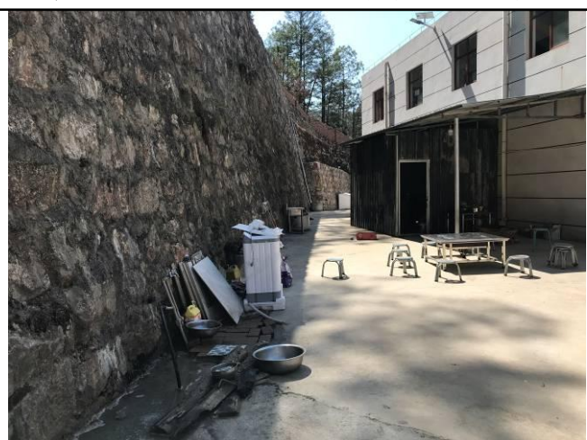
照片 7 项目区东侧浆砌石护坡挡墙现状