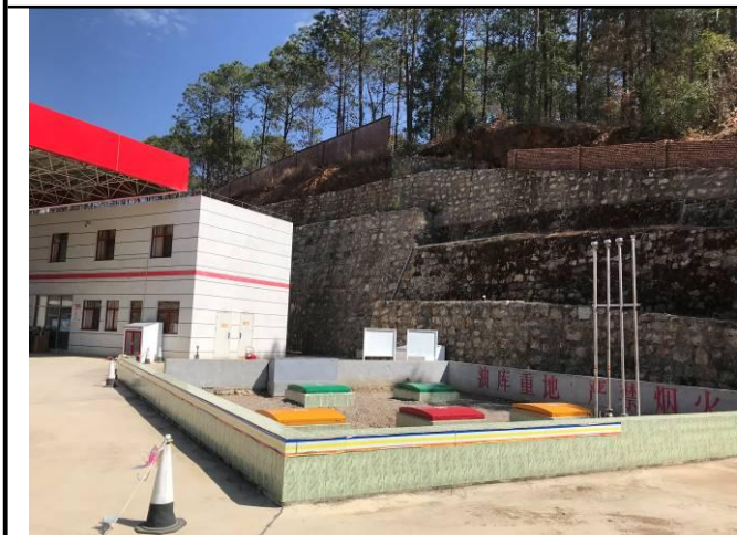
照片 14 储油罐现状