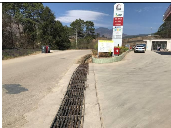
照片 13 入口处盖板排水沟现状