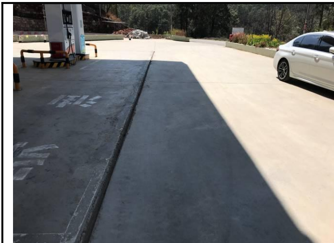
照片 10 项目区内场地硬化现状