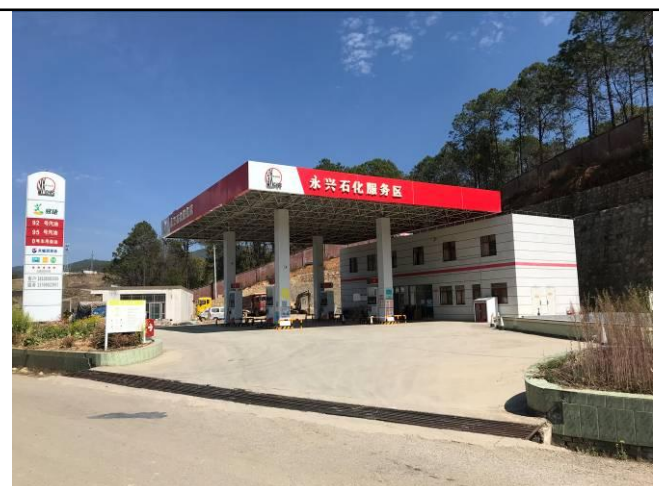
照片3 加油站罩棚及场地硬化现状