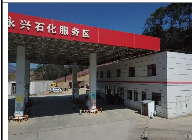
照片2 加油站罩棚及场地硬化现状