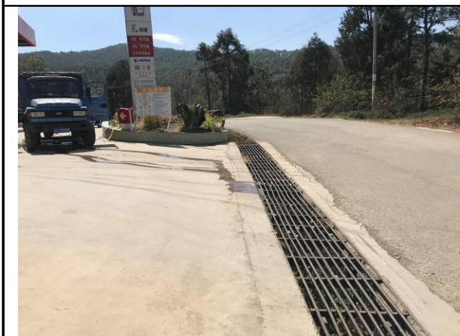
照片 12 出口处盖板排水沟现状