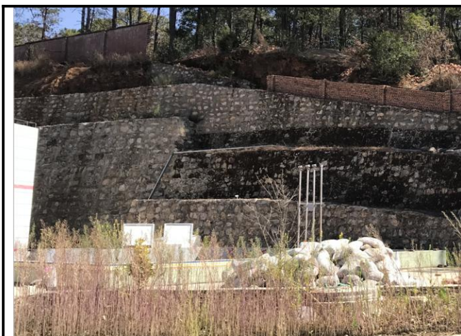
照片 4 项目区东侧浆砌石护坡挡墙及砖砌围墙现状