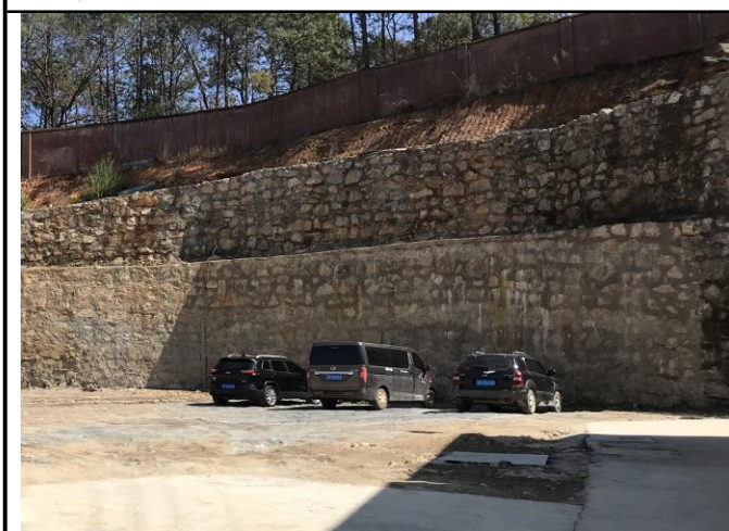
照片 6 项目区东侧浆砌石护坡挡墙及砖砌围墙现状