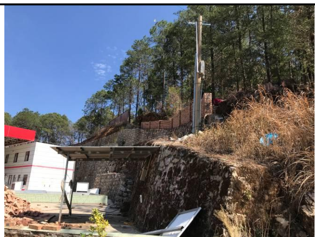
照片 5 项目区东侧浆砌石护坡挡墙及砖砌围墙现状