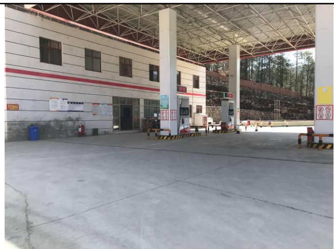
照片 9 项目区内场地硬化现状