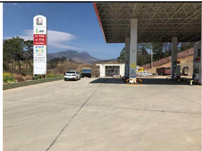
照片 11 项目区内场地硬化现状