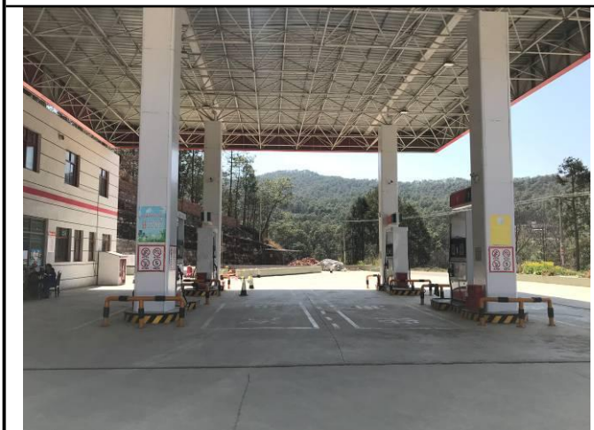
照片 8 项目区内场地硬化现状