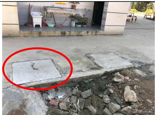
照片 15 场地周边排水涵管现状