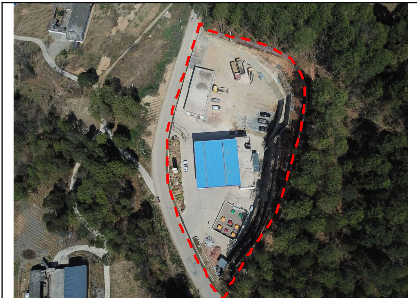
照片1 加油站航拍全貌现状